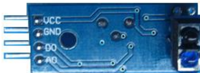
圖二：TCRT 5000 感測模組背面