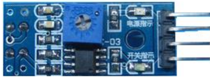
圖一：TCRT 5000 感測模組正面